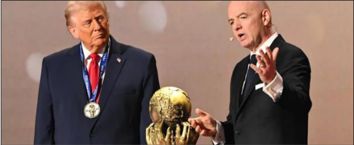
נשיא פיפ"א ג'אני אינפנטינו מעניק את "גביע השלום" לדונלד טראמפ, דצמבר 2025