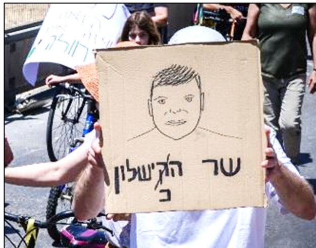
"שר הקישלון" מפגינים נגד שר החינוך קיש בדרישה לתנאי שכר טובים יותר (למורים)

שר החינוך יואב קיש (הליכוד) הוא מהשרים השנואים בממשלה ובצדק רב. תחתיו נקלעה מערכת החינוך לצניחה חופשית; הישגי התלמידים נמצאים בשפל היסטורי; ויותר מורים ומנהלים עוזבים את המערכת. שמו עולה שוב ושוב בהפגנות נגד הממשלה. במחאות שמתקיימות מול ביתו מבצעת המשטרה מעצרים אלימים של מפגינים. הדימוי הנלעג של קיש במערכוני "ארץ נהדרת" מגרד את פני השטח של דמותו הרודנית.