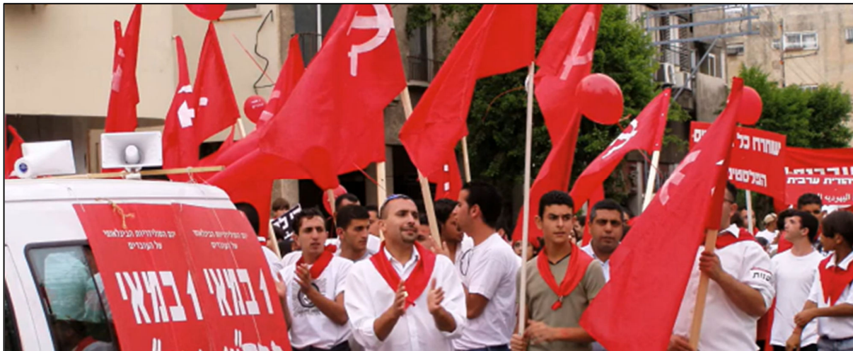
הפגנת ה-1 במאי - מתוך הסרט 'ברית הנוער הקומוניסטי הישראלי, סיפורים מאז ומתמיד' של ערן טורבינר המופיע בעמוד ארכיון מק"י ביوتيוב