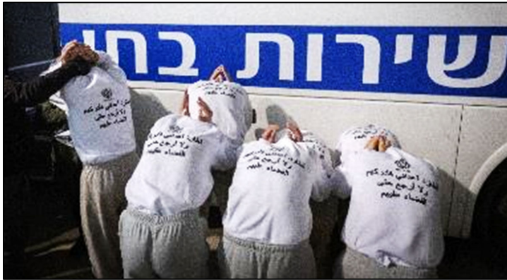
אסירים-חטופים מעזה בעת מעברם בחזרה לרצועה במסגרת עסקת החטופים בפברואר 2025. האסירים הוחזרו לרצועה כשהם לובשים חולצה ועליה סמל השב"ס והכיתוב: "ארדוף את אויבי ואשיג אותם, ולא אשוב עד שאחסל אותם"

ובמשך שנתיים, ללקוח שלי היה אותו זוג תחתונים. זאת עד לעתירה שהגשתי בשמו ב-2025.