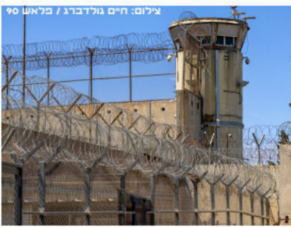
מעשה במשקפיים בבית הכלא עמ' 5