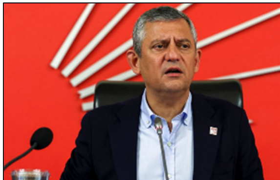
אחגור אוזל, מנהיג האופוזיציה הטורקית המודח

שלטונו של נשיא טורקיה רג'פ טאיפ ארדואן פתח לפני כשבועיים במסע רדיפה נוסף נגד האופוזיציה במדינה. מאות שוטרים חמושים פרצו (24.5) למטה הארצי של מפלגת העם הרפובליקאית – מפלגת האופוזיציה הגדולה במדינה, תוך ירי גז מדמיע וקליעי גומי. השוטרים פינו את הבניין בכוח וסגרו אותו עד להודעה חדשה, לאחר שמפלגת האופוזיציה סירבה להכיר בהחלטה שערורייתית של בית המשפט הטורקי נגדה. מערכת המשפט בטורקיה איבדה זה כבר את עצמאותה, ועתה היא נשלטת לחלוטין בידי שלוחי הממשלה ומשמשת כלי בידי ארדואן לרדיפת מתנגדיו. ב-21 במאי הכריז בית המשפט באנקרה כי הבחירות הפנימיות שקיימה מפלגת העם הרפובליקאית לבחירת הנהגתה ב-2023 לא נערכו לפי החוק, וכי תוצאותיהן בטלות ומבוטלות. משמעות ההחלטה היא – הדחת מנהיג האופוזיציה אוזגור אוזל, הנחשב יריבו המרכזי של ארדואן.