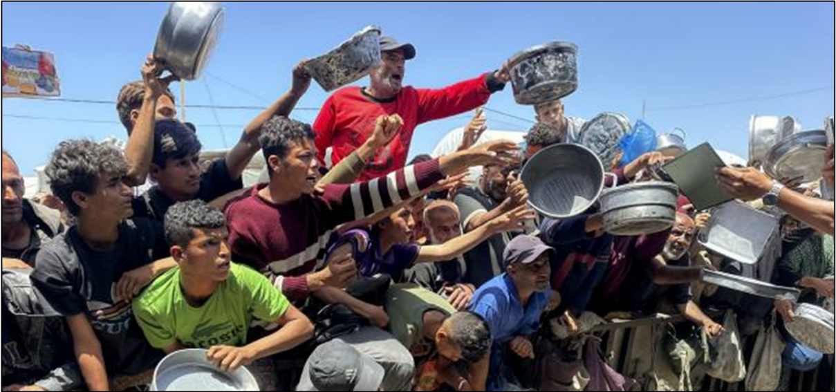
עקורים בתור לאוכל בחאן יונס, מאי 2026