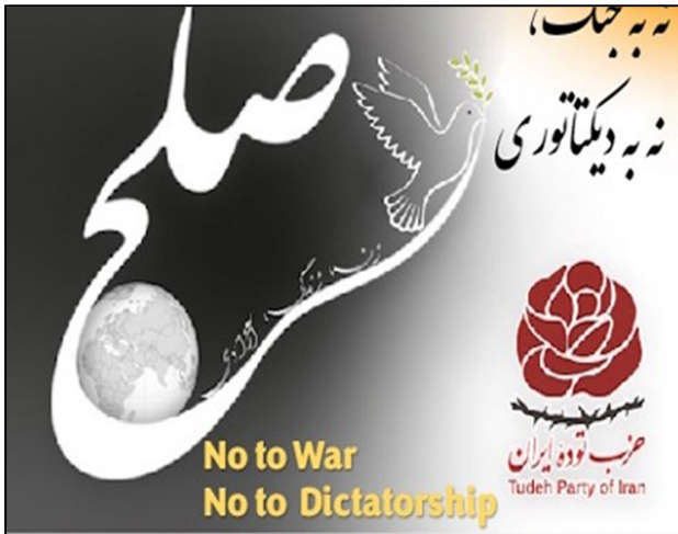
כרזה נגד המלחמה של מפלגת טודה האיראנית

המלחמה באיראן ולהרחיבה, במטרה להרוס את מולדתנו ולכפות עליה משטר פרוקסי מסוגו של רזא פהלווי", מסרה. עוד הדגישה המפלגה: "יש לעשות כל מאמץ לעצור את התוכניות הזדוניות של ממשלת נתניהו לחבל בהפסקת האש ולגרור את איראן וארה"ב למלחמה ממושכת והרסנית. ארצנו כבר ספגה אבידות כבדות בנפש וברכוש במשך יותר מחודש של הפצצות אמריקאיות וישראליות. המשך המלחמה יהיה אסון כבד לעתיד הארץ".