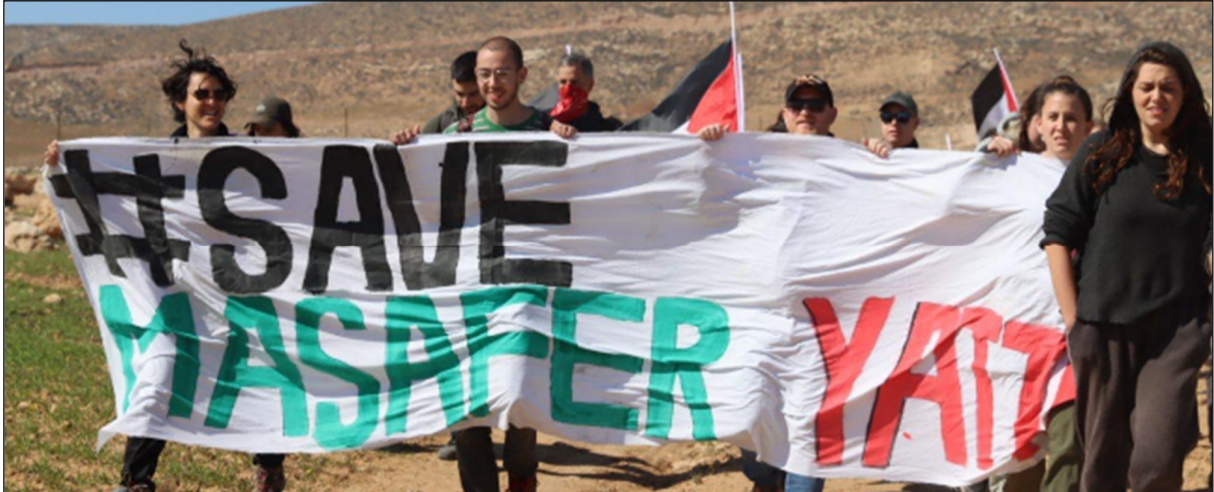
מפגינים בדרום הר חברון בשטחים הפלסטיניים הכבושים בסולידריות עם תושבי מסאפר יטא, פברואר 2023